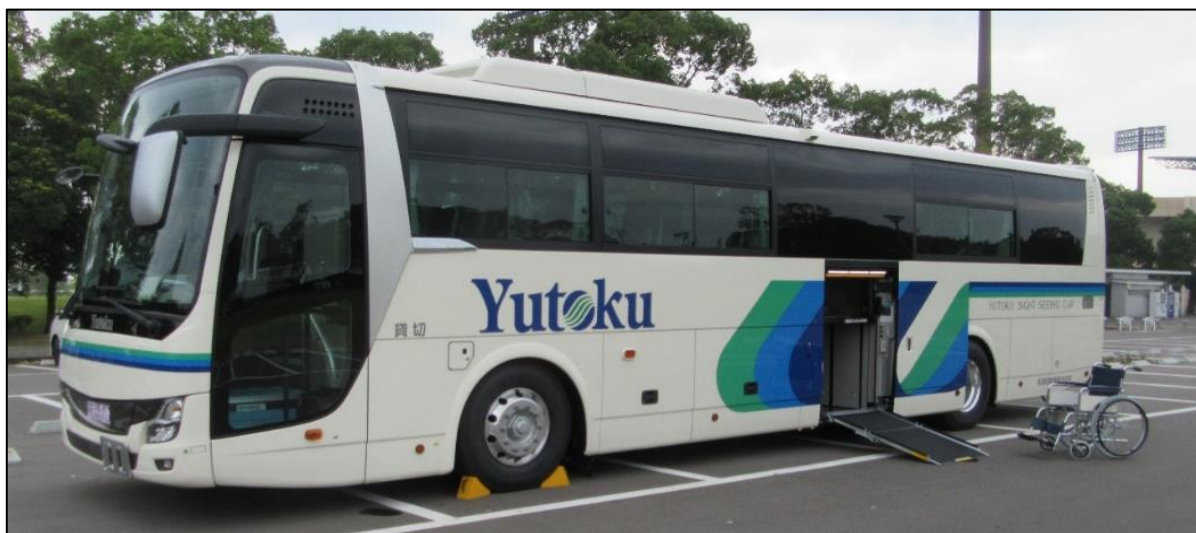
令和元年10月導入のエレベーター付き貸切バス

弊社では、お客様に安心してご乗車いただくために、新型コロナウイルス感染拡大の予防のため下記の様な対策に取り組んでおります。